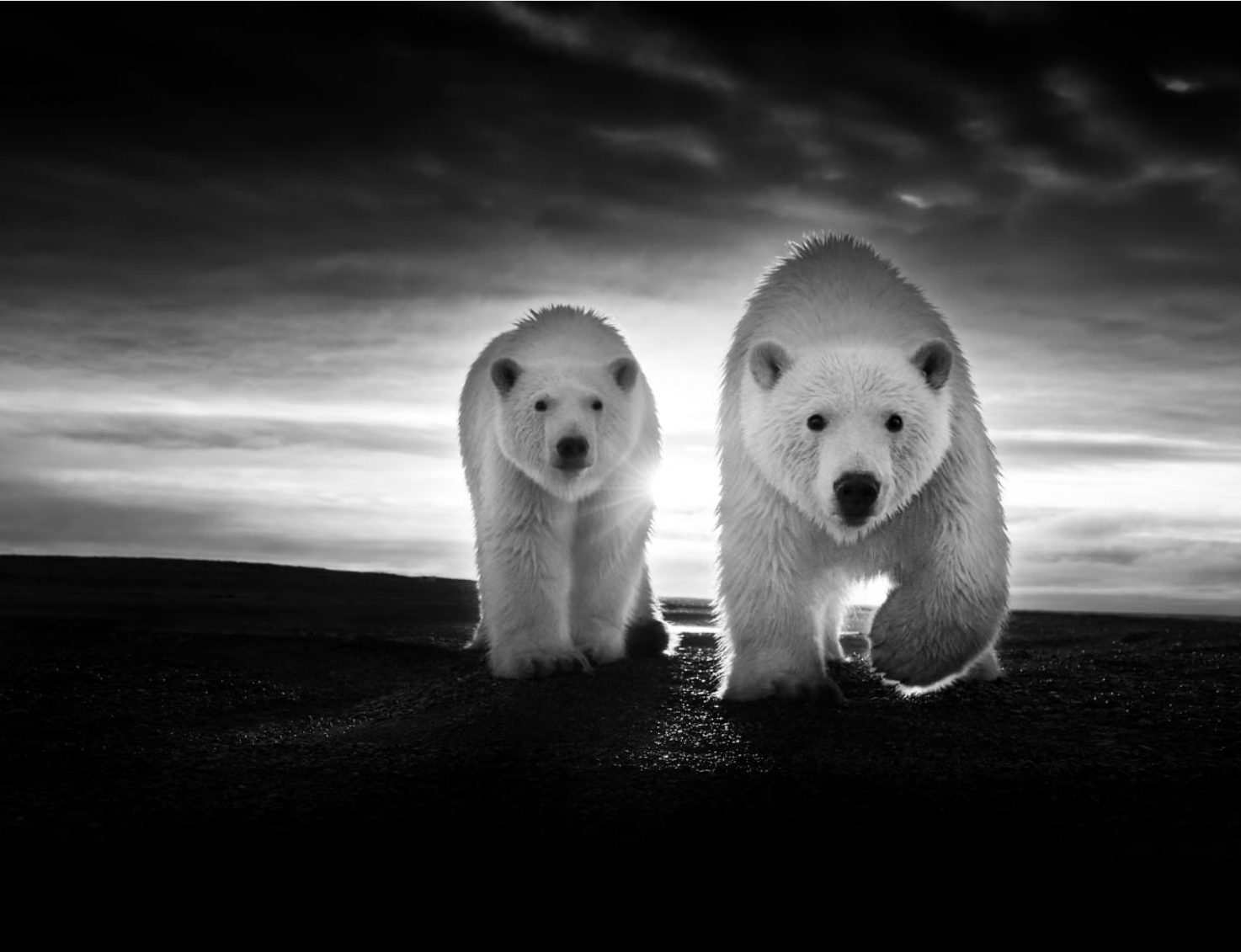
Photographer of the Year (Profis) und 1. Platz Profikategorie Wildlife : Kyriakos Kaziras (F) »Body and soul«